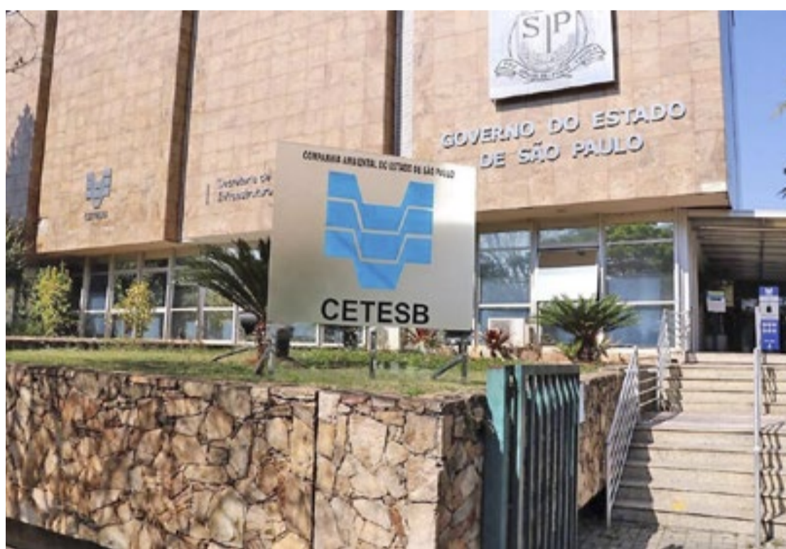
As oportunidades oferecem áreas de atuação como analista ambiental e analista de tecnologia

Com foco nas atividades de licenciamento, fiscalização e atendimento de emergências, os novos profissionais desempenharão papel fundamental na garantia da excelência dos serviços prestados pela Companhia ao meio ambiente e à população de SP. O concurso surge como resposta à crescente demanda por agilidade nos prazos de atendimento na solicitação de serviços ambientais.