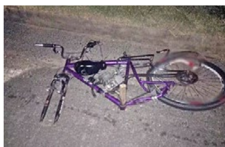
A vítima foi socorrida e encaminhada a uma Unidade de Pronto Atendimento da cidade do interior, mas morreu no hospital

Segundo informações da Polícia Rodoviária, a caminhonete trafegava pela faixa dois, quando atingiu a vítima, que pilotava uma bicicleta motorizada. A bicicleta ficou caída entre a faixa dois