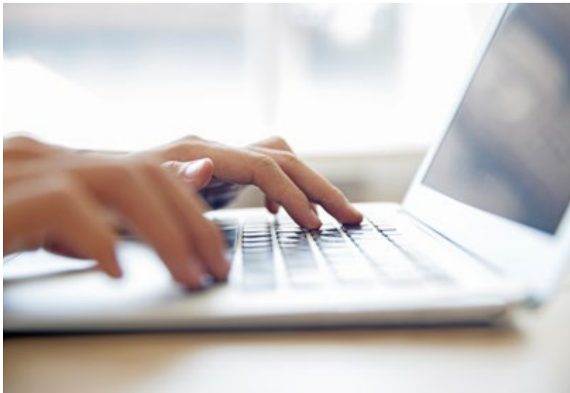
Porto Feliz abre vagas para estágios na prefeitura e para cursos gratuitos; saiba como se candidatar

a partir dos 16 anos. Para fazer a inscrição é preciso apresentar cópias do RG, CPF, comprovante de endereço e histórico escolar. Para menores de 18 anos, necessário CPF do responsável.