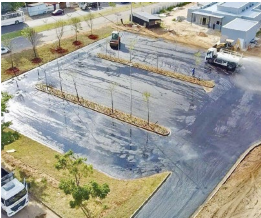
Equipes da Secretaria de Serviços Públicos finalizaram o asfalto do estacionamento do novo PS

Entidade filantrópica sem fins lucrativos, a Santa Casa dedica pelo menos 60% dos seus atendimentos e procedimentos aos pacientes do Sistema Único de Saúde (SUS). (Leonardo Sandre, sob supervisão de Matheus Herbert)