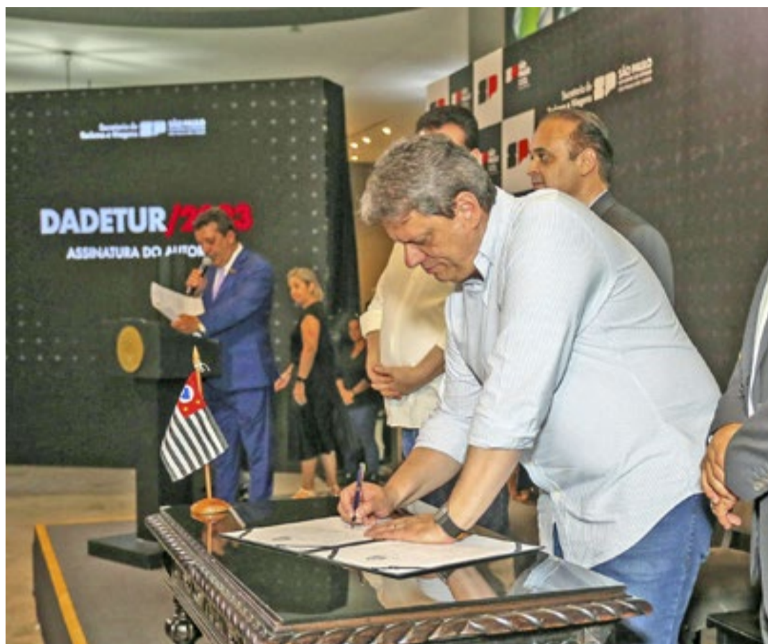
Tarcísio autorizou R$ 335 milhões para obras em 182 municípios turísticos do estado de São Paulo

“São recursos que levam desenvolvimento a municípios de enorme vocação turística, geram novos fluxos de visitantes e criam oportu-