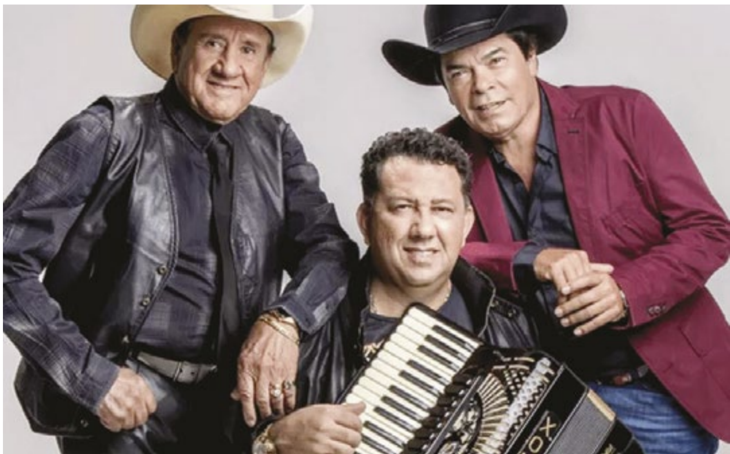
Trio Parada Dura é um dos destaques na programação de shows deste ano em Porto Feliz; apresentação será na tarde deste domingo (9)

Segundo a organização, a 4ª AgroPorto tem como objetivo fomentar o agronegócio, com exposições de produtores e máquinas agrícolas, balcão de negócios, exposições de orquídeas, representantes de empresas comerciais para investimentos e oportunidades. (GSP)