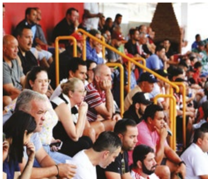
O jogo que definirá o campeão da 3ª Taça João Rubini acontece neste domingo (9), às 10 horas da manhã, no campo da AAP

Na etapa final, o União chegou ao terceiro gol com Nunes, aos 22 minutos. O América ainda descontou aos 30 minutos, com Wag-