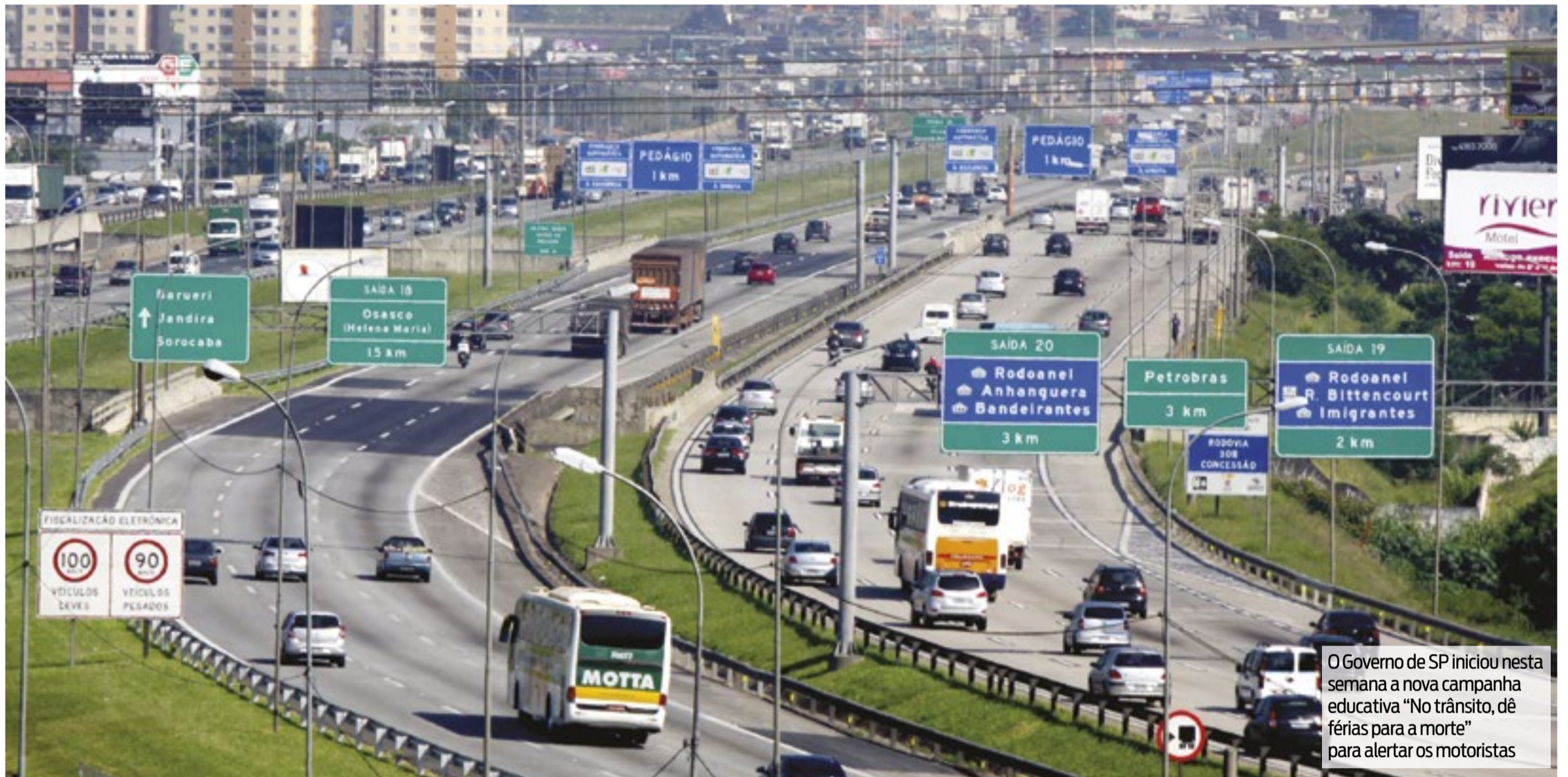
O Governo de SP iniciou nesta semana a nova campanha educativa "No trânsito, dê férias para a morte" para alertar os motoristas