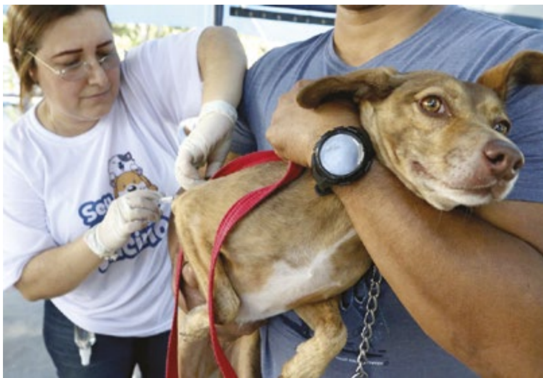
Para realizar a vacinação nos pets é necessário apenas se dirigir ao local organizado pela prefeitura

Após a incubação, o paciente passa por um período