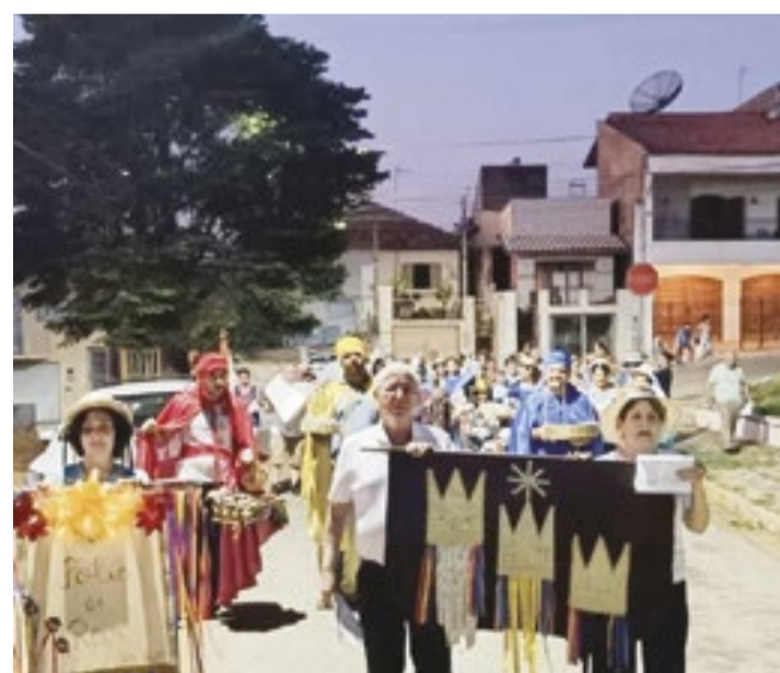
Durante o final da madrugada e início da manhã, os participantes da Folia de Reis visitaram as residências dos devotos na cidade

A Folia dos Reis é uma celebração de origem espanhola e portuguesa. Há estudiosos que defendem que a celebração tenha chegado ao Brasil ainda durante o período de colonização. Dessa forma, a Folia dos Reis pode ter sido usada como forma de catequi-