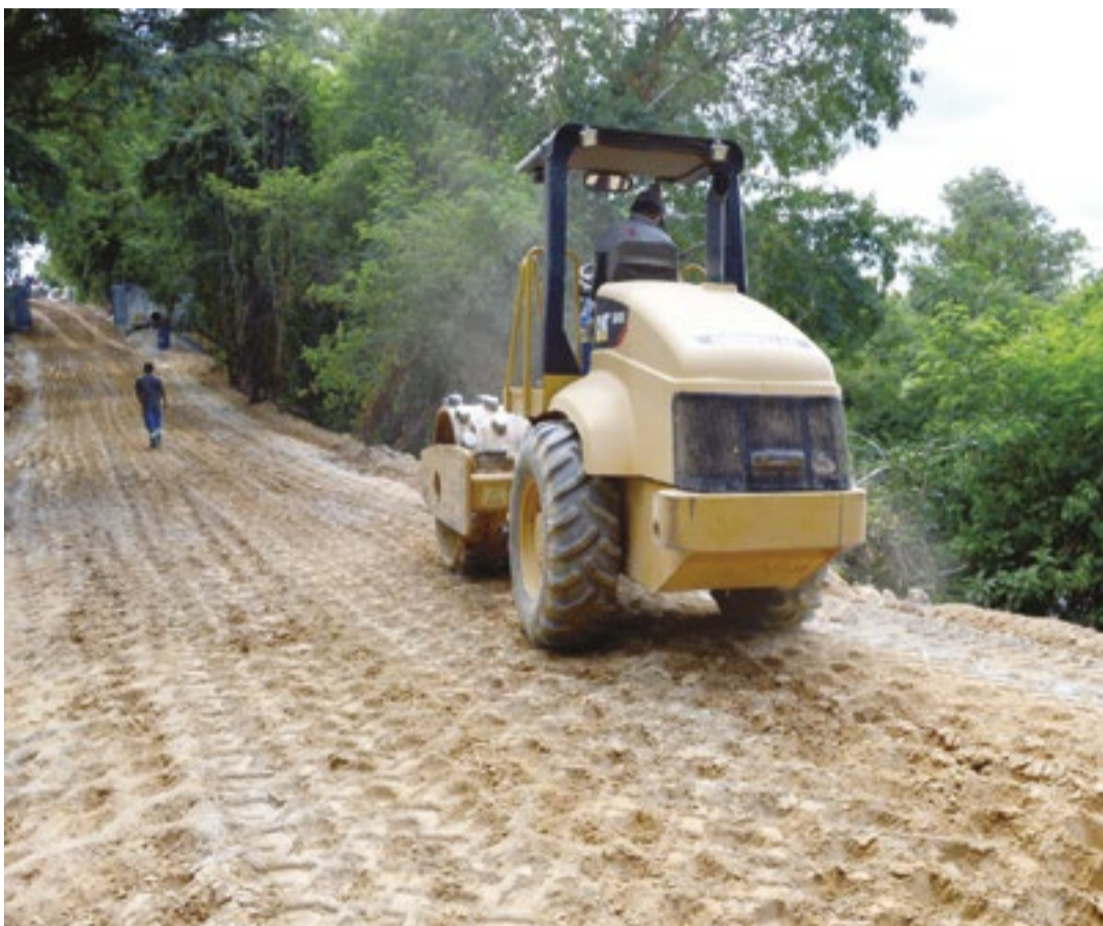
Estrada do Parque em Porto Feliz, no interior de São Paulo, passa por revitalização completa

Na última semana, foram realizados serviços para a instalação dos pisos intertravados