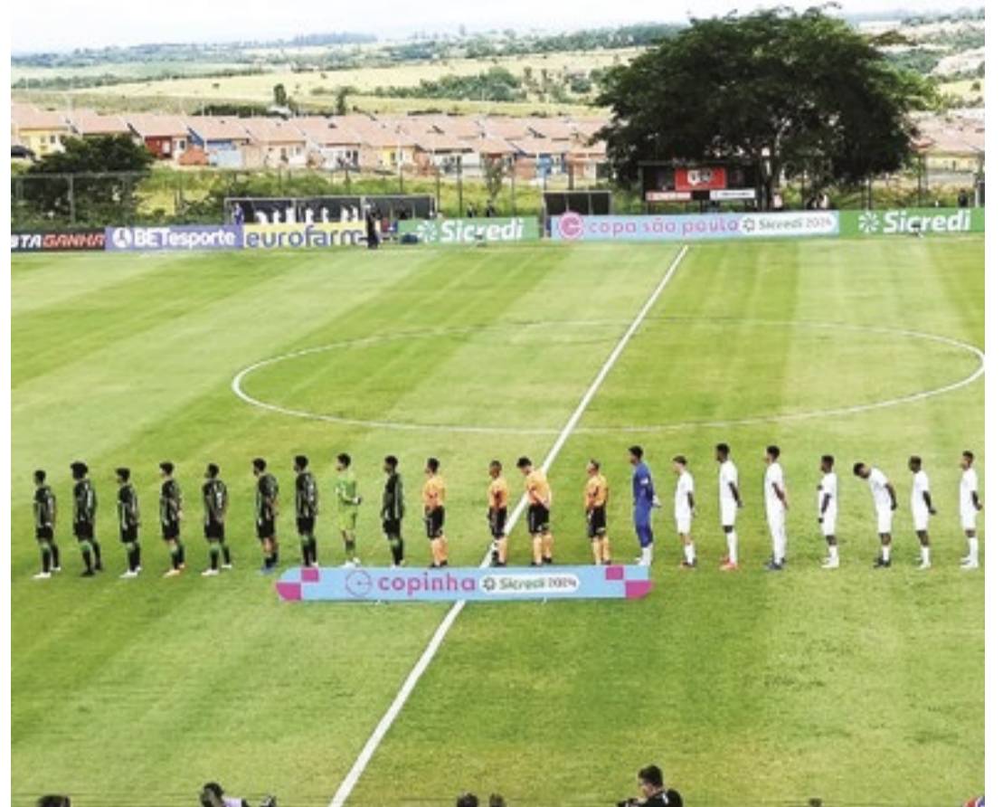
Campeão em 1996, o time mineiro foi semifinalista em 2022 e vice-campeão em 2023; o DB se despede de forma invicta, já que venceu os três jogos da primeira fase e empatou no último jogo

O terceiro jogo do Desportivo empolgou a torcida porto-felicense. Jogando com bastante confiança e entrosamento, o Desportivo Brasil venceu o Santa Cruz por 3 a 0, no estádio Ernesto Rocco. O jogo aconteceu nesta terça-feira (9). O DB classificou em primeiro lugar no Grupo 16,